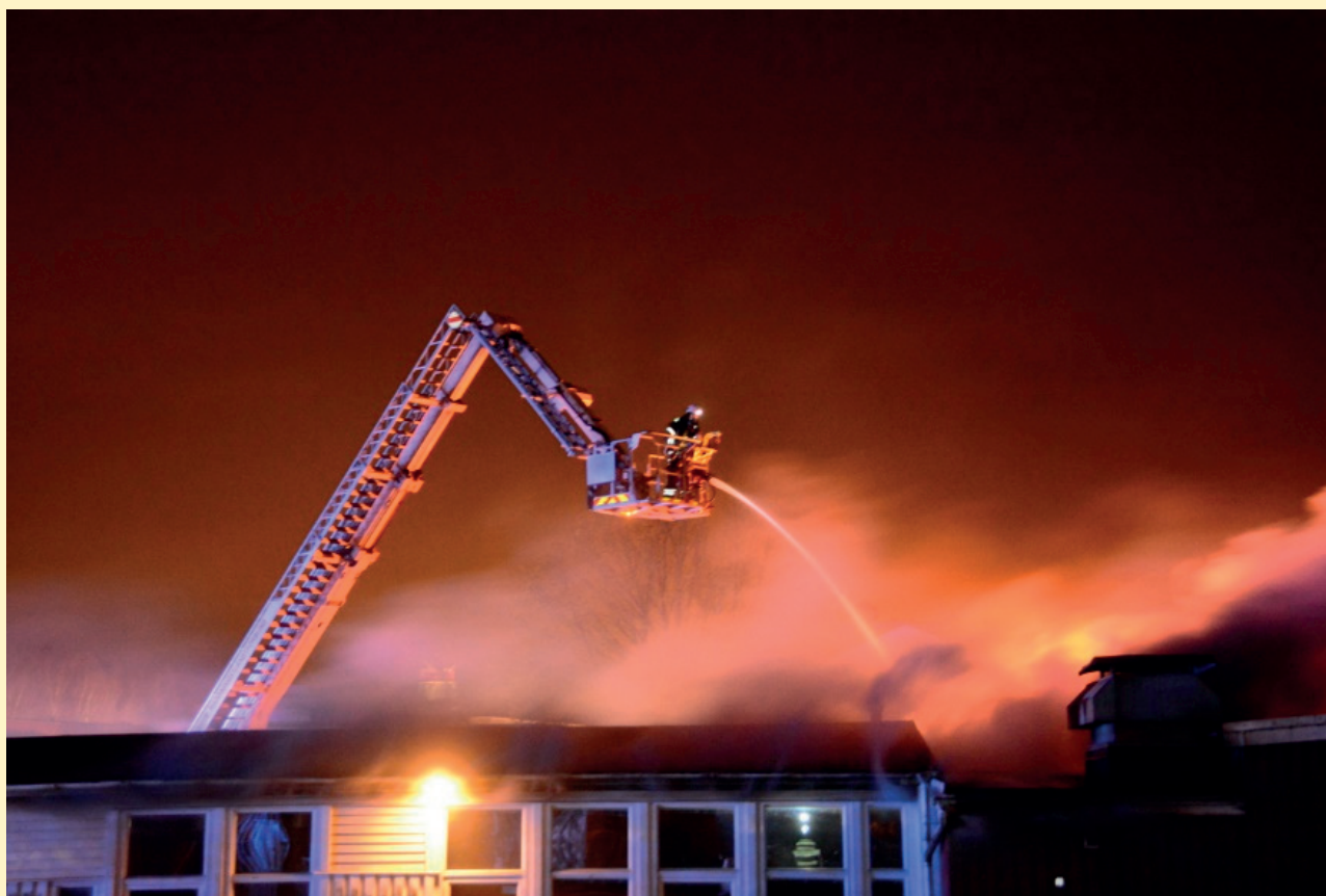
Räddningsarbetet med Thorildskolan 29 april 2017.